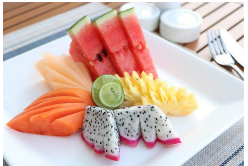
30 ผลไม้รวม FRESH FRUIT IN SEASON 120.-